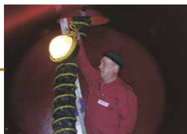
Tankreinigung / resp. Tankrevision