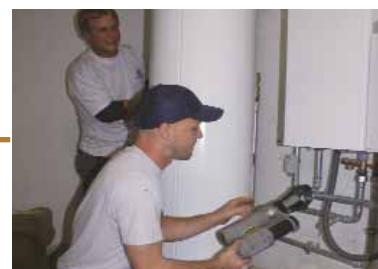
Installation neuer Heizkessel