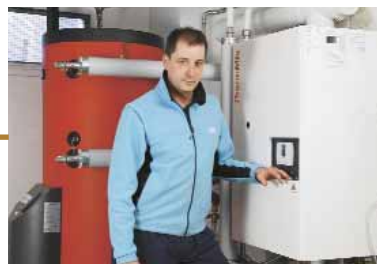
Inbetriebnahme der neuen Heizung