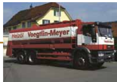
Lieferung neues Öko-Heizöl 50 ppm

Gerne offeriert Ihnen die Firma Erismann GmbH Brugg Ihren modernen und zukunftsweisenden Öl-Wand-Brennwertkessel. Voegtlin-Meyer AG berät Sie gerne über die neue Heizölqualität sowie über die Tankreinigung und den Produktwechsel.