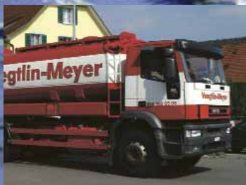
Mitnahme Restöl (mit Gutschrift)