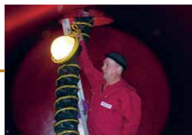
Tankreinigung / resp. Tankrevision