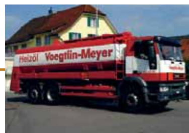
Lieferung neues Öko-Heizöl 50 ppm

Gerne offeriert Ihnen die Firma Heizteam AG Ihren modernen und zukunftsweisenden Brennwertkessel. Voegtlin-Meyer AG berät Sie gerne über die neue Heizölqualität sowie über die Tankreinigung und den Produktwechsel. Wir freuen uns auf den Kontakt mit Ihnen!