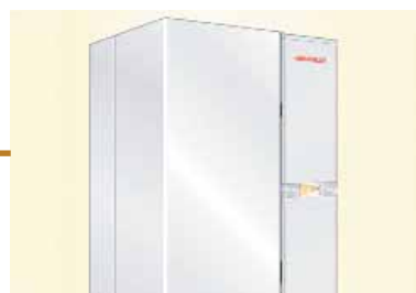
Inbetriebnahme der neuen Heizung