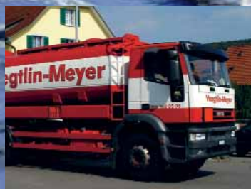
Mitnahme Restöl (mit Gutschrift)