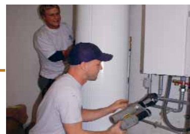
Installation neuer Heizkessel